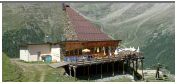
Bergrestaurant-Bar K2/Langenstein (2.350 m) Ristorante-Bar K2/Orso

Rifugio Tabaretta, Rifugio Coston, Rifugio Payer, Ortles ecc.