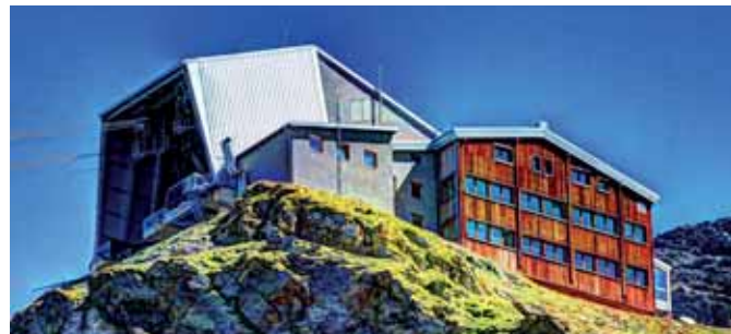
Restaurant-Bar Bergstation (2.610 m) Ristorante-Bar Stazione a monte