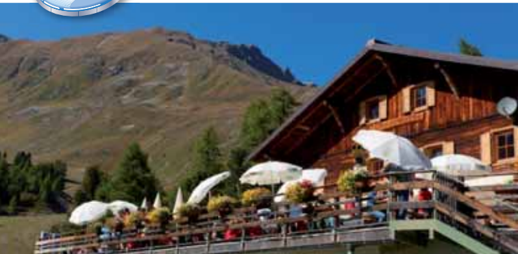
Furkelhütte | Rifugio Forcola (2.250 m)

Mit unserem Sessellift erreichen Sie bequem die Furkelhütte (2.250 m). Sie können sich dort kulinarisch verwöhnen lassen oder einfach die Sonne auf der Terrasse auf sich wirken lassen. Genießen Sie den beeindruckenden Panoramablick auf den Ortler und das Stifserjoch!