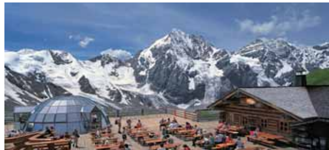
Madritschhütte (2.820 m) Rifugio Madriccio