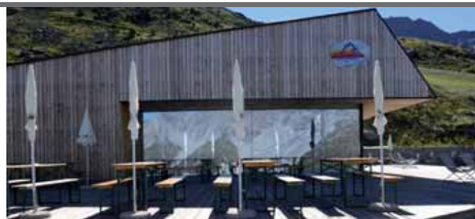
Bergrestaurant-Bar Kanzel (2.350 m) Ristorante-Bar Pulpito

Rifugio Serristori, Val Rosim + ghiacciai, Passo di Zay, Malga dei Vitelli, ecc.